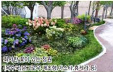
주동선- 가로정원 조성